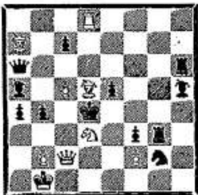
De Duinengalm 10/01/1936