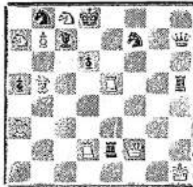
De Duinengalm 17/01/1936

Zaterdag 19 Januari, om 19 u. 30, in het Bristol Hotel, tweede wedstrijd Oostende-Ieperen.