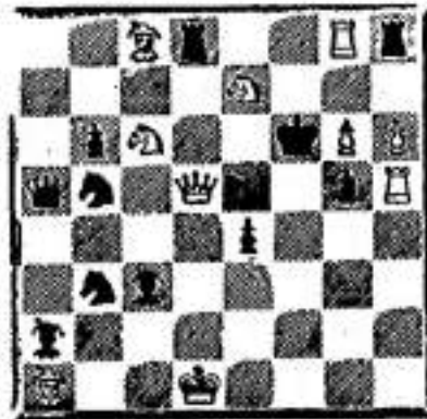
De Duinengalm 24/01/1936