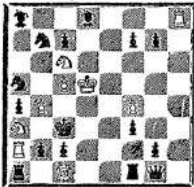
De Duingalm 24/04/1936

1) P65 — Kd3; 2) P65sch. — Ke2; 3) Pe3sch. — Kf2; 4) Pd3sch. — Kg3; 5) Pe4sch. — Kg4; 6) P65 — Kf5; 7) Pg3sch. — Kf6; 8) Pg4sch. — Ke7 9) Pf5sch. — Kd5; 10) P65sch. Ke8; 11) P67sch. — Kb8; 12) Pd7sch. — Ka7; 13) Pe8sch. — Ka6; 14) Pb8sch. — Kb5; 15) Ta7sch. — Kb4; 16) Pa6sch. — Kc6; 17) P65 — Kd3; 18) Pb4 sch. — Ke2; 19 tot 30 dezelfde zetten van 3-14. Kb5); 31) T-b3sch. — Pb3; 32) Pa7sch. — Kb4; (Als 32)..., Ka5; 33) Ld2sch. — Pd2; 34) Tb5 mat; 35) Pe5sch. — Kc3; 34 tot 44 dezelfde zetten van 1 tot 11. Kb8; 45) P65sch mat.