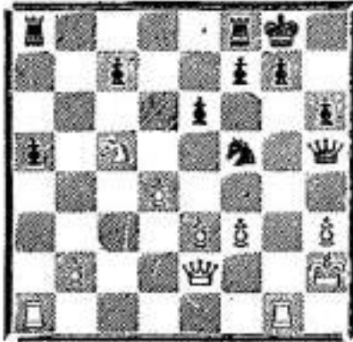
Diagram stand naar den 27 zet wit.